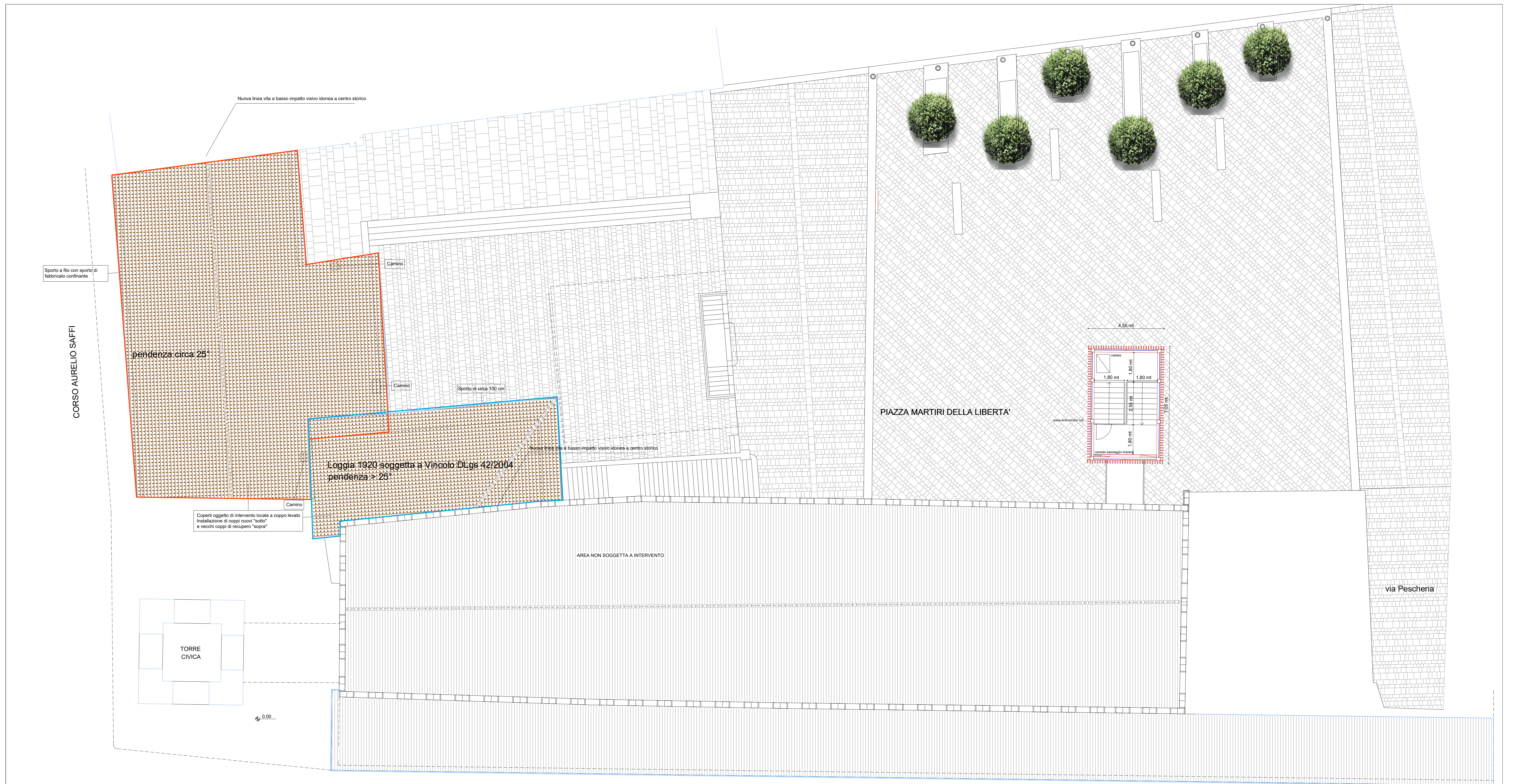
planimetria delle coperture SC 1:100 Progetto architettonico Il Stralcio Funzionale

LEGENDA: — area intervento VISTE PALAZZO DEL PODESTÀ